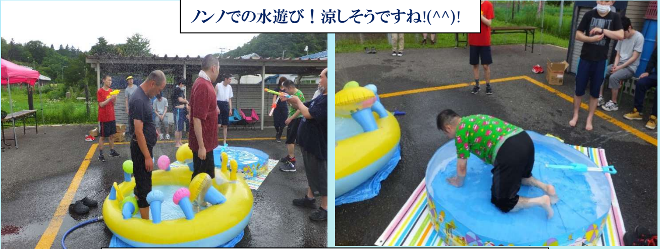
ハンノでの水遊び！涼しそうですね!(^^)!