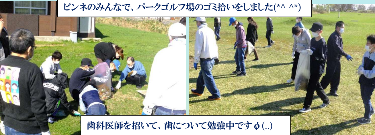
ピンネのみなで、パークゴルフ場のゴミ拾いをしました(*^-^*)